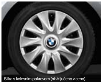
Slika s kolesnim pokrovom (ni vključeno v ceno).

Jekleno platišče kot zimski komplet koles, Goodyear ULTRA GRIP 8*, 195/55 R16 87 H za BMW serije 1 od 09/2011.