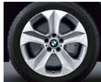
Star spoke 232 kot zimski komplet koles, Goodyear ULTRA GRIP* RSC, 255/50 R19 107 V za BMW X6.