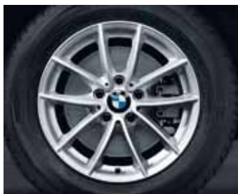
V spoke 304 kot zimski komplet koles, Dunlop SP Winter Sport 3D*, 225/60 R17 99 H za BMW X3.

Tudi pri temperaturah okrog 7° C in seveda vse kar je nižje, letne pnevmatike ne zagotavljajo več optimalnega oprijema, saj se kavčukova zmes strdi in ogrozi varnost. Originalni seti zimskih kompletov koles BMW z zimskimi pnevmatikami nudijo odlično zmogljivost z vidika oprijema, krmiljenja in obnašanja med vožnjo, kar zagotavlja skrajno obliko užitka v vožnji tudi na snegu in ledu.