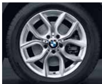
Y-spoke 308 kot zimski komplet koles, Pirelli W 210 Sottozero* RSC, 245/50 R18 100 H za BMW X3.