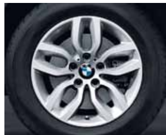
Y-Spoke 305 kot zimski komplet koles, Pirelli W 210 Sottozero 2* RSC, 225/60 R17 99 H za BMW X3.