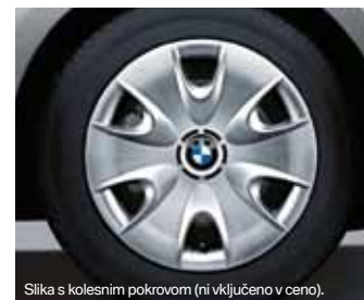
Slika s kolesnim pokrovom (ni vključeno v ceno).

Jekleno platišče kot zimski komplet koles, Goodyear ULTRA GRIP 7+*, 195/55 R16 87 H za BMW serije 1.