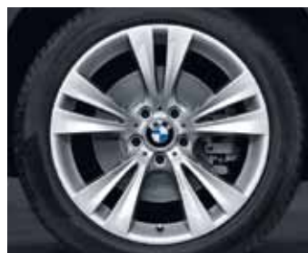
Double spoke 309 kot zimski komplet koles, Dunlop SP Winter Sport 3D* RSC, 245/45 R19 102 V za BMW X3.