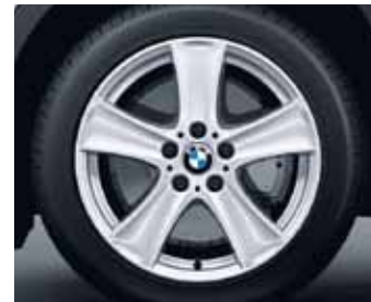
Star spoke 209 kot zimski komplet koles, Dunlop Grandtrek WT M3* RSC, 255/55 R18 109 H za BMW X5.