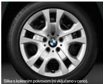
Slika s kolesnim pokrovom (ni vključeno v ceno).

Jekleno platišče kot zimski komplet koles, Dunlop SP Winter Sport 3D, 225/50 R17 94 H za BMW X1.