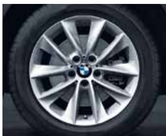
V-spoke 307 kot zimski komplet koles, Dunlop SP Winter Sport 3D* RSC, 245/50 R18 100 H za BMW X3.

Z veseljem vam pregledamo globino profila na vaših aktualnih pnevmatikah.