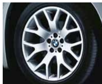
Cross spoke 177 kot zimski komplet koles, Bridgestone Blizzak LM 25 4x4* RSC, 255/50 R19 107 V za BMW X5.