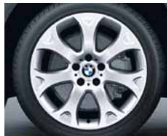
Y-spoke 211 kot zimski komplet koles, Goodyear ULTRA GRIP* RSC, 255/50 R19 107 V za BMW X5.